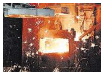
Die Carolinenhütte fertigt auch hochwertige Gussteile.