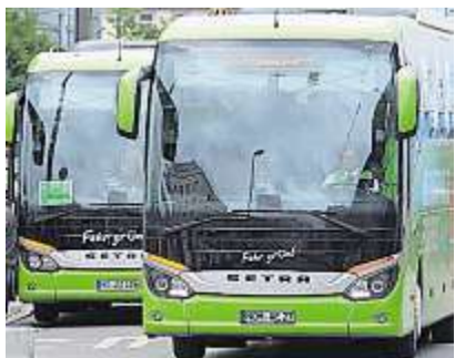
Fernbusse werden bei den Deutschen immer beliebter.

BERLIN. Fernbusse werden für immer mehr Menschen in Deutschland zur Reisealternative. An den Osterfeiertagen fuhren so viele Gäste beim Marktführer FlixBus mit wie noch nie in der Unternehmensgeschichte. Im Vergleich zu Ostern 2016 habe es im deutschsprachigen Raum ein Plus von zehn Prozent gegeben, teilte das Unternehmen mit. Zu den beliebtesten Zielen zählten Berlin, München, Hamburg, Frankfurt und Dresden. (dpa)